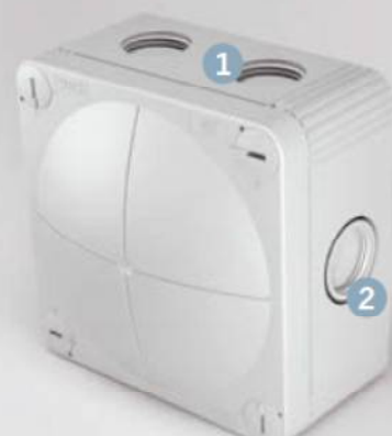
メンブレンとネジ止め(1) 拡張性のための切り込み(2)