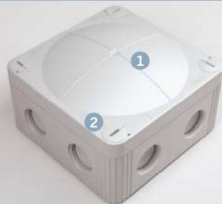
ドーム型カバーでの内部容量アップ(1) 取り外し容易な四隅ネジ(2)